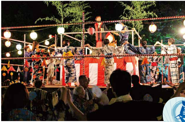
地域との交流（盆踊り等）