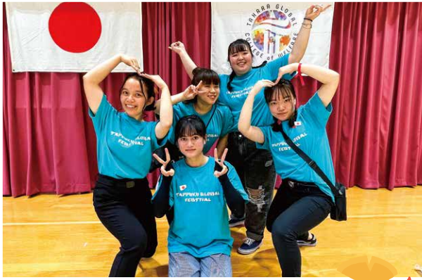
学校最大のイベント『たっぶく祭』