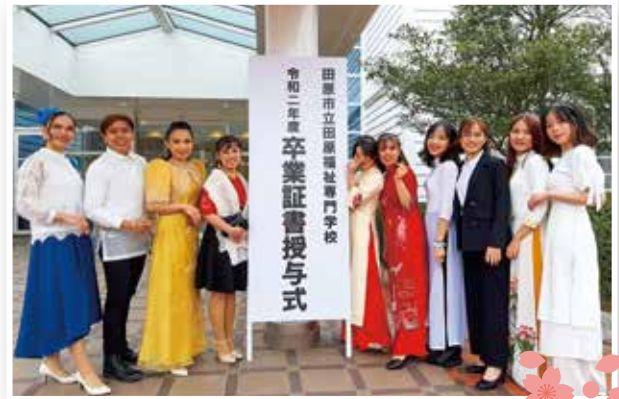
Lễ tốt nghiệp