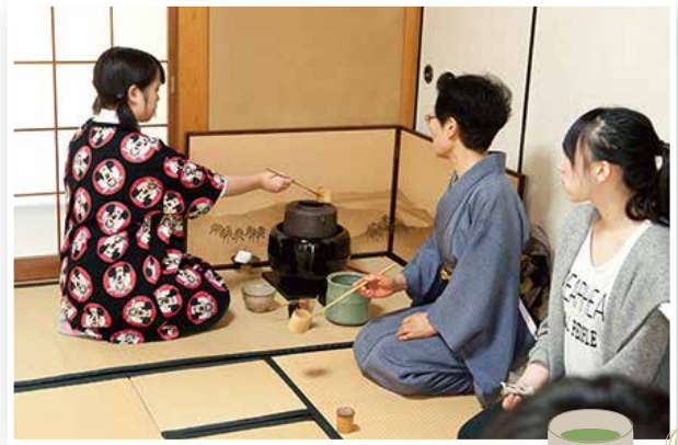
Trải nghiệm học hỏi văn hóa truyền thống Nhật Bản