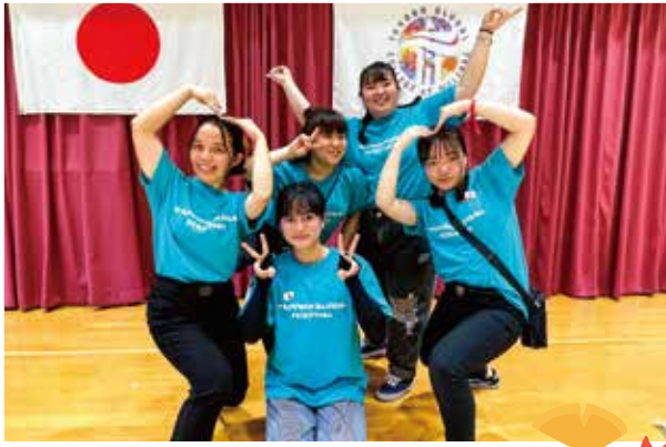
Sự kiện lớn nhất của nhà trường 『LỄ HỘI TAPPUKU』

Có các hoạt động sự kiện giao lưu với người dân địa phương. Ngoài ra cũng có hoạt động học hỏi văn hóa truyền thống Nhật Bản.