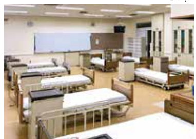
Phòng thực hành kaigo