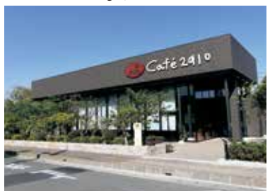
Cafe căn tin