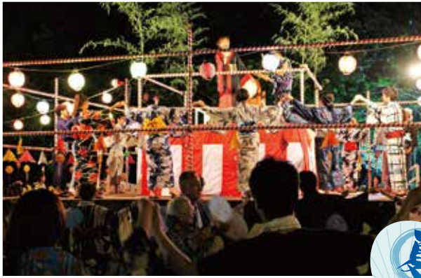
Giao lưu với địa phương (ví dụ như nhảy điệu bon)