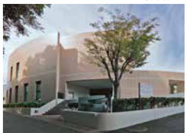
Ký túc xá nữ